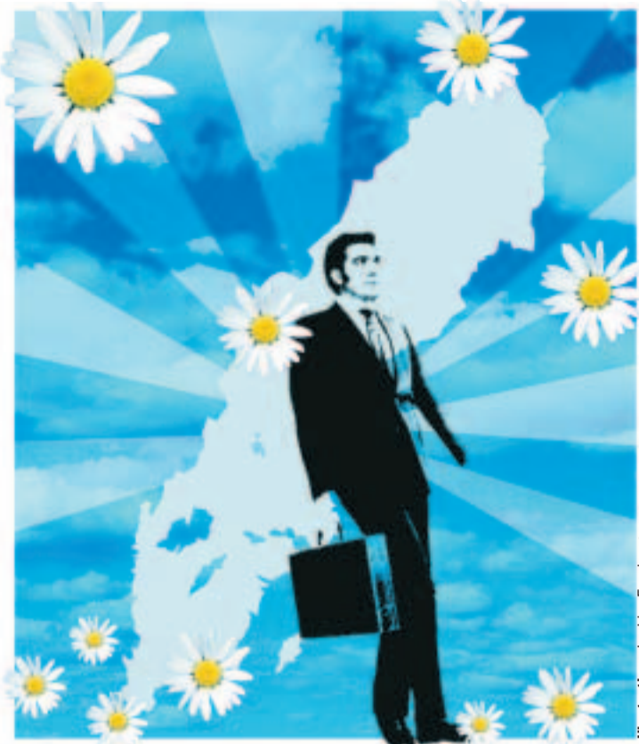
Illustration: Joakim Forsberg